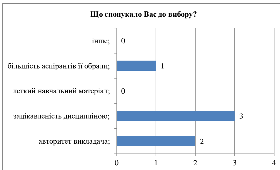
Рис.1. Причини вибору навчальних дисциплін

Анкетування показало, що 1 здобувач вказав, що обрав ті навчальні дисципліни, які обрала більшість аспірантів, водночас 3 з 4 здобувачів зазначили, що до вибору обраних дисциплін їх спонукала зацікавленість у ній, а ще 2 з 4 аспірантів обрали навчальні дисципліни через авторитет викладача.