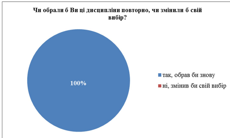
Рис. 2. Бажання респондентів обрати ті ж самі, або обрати нові навчальні дисципліни

Здобувачі, згідно з результатом анкетування, що відображений на рис. 3, вважають обрані дисципліни цікавими та необхідними.