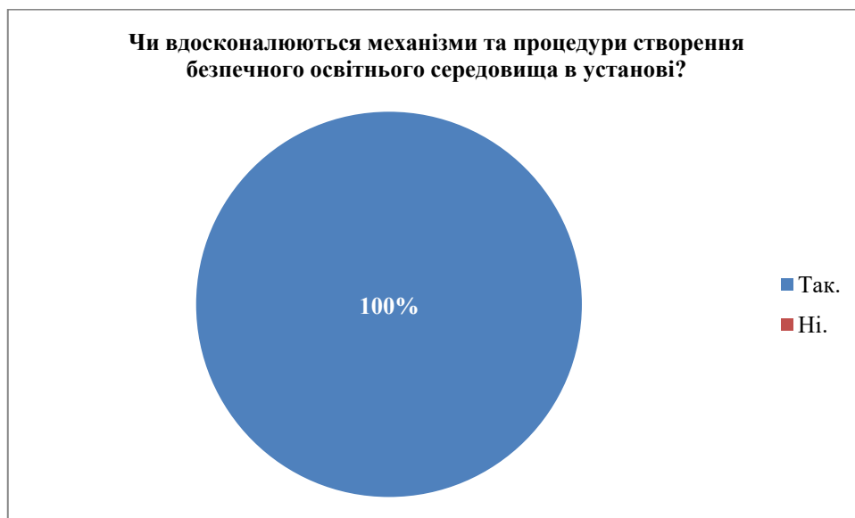
Рис. 7. Вдосконалення механізмів та процедури створення безпечного освітнього середовища в установі

Всі опитані здобувачі вважають, що механізми та процедури створення безпечного освітнього середовища в установі вдосконалюються.