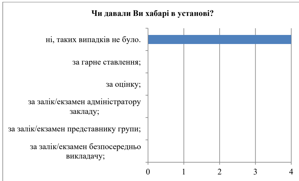
Рис.4. Хабарництво в установі

На рис. 5 відображено відповіді на питання: Які заходи в установі вживаються з метою підтримки психічного здоров'я здобувачів вищої освіти?