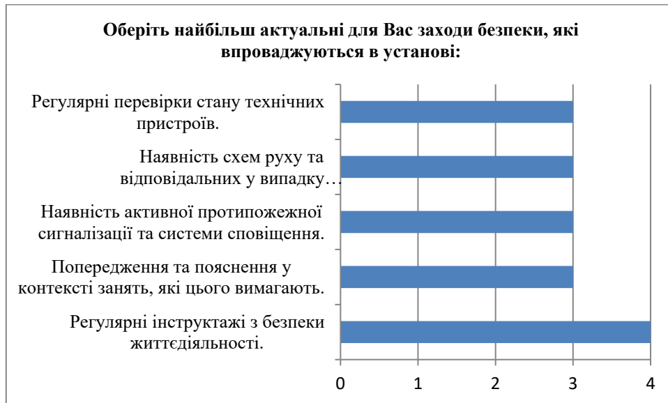
Рис. 6. Найактуальніші заходи безпеки, які впроваджуються в установі, на думку здобувачів

Всі опитані здобувачі вважають, що механізми та процедури створення безпечного освітнього середовища в установі вдосконалюються.