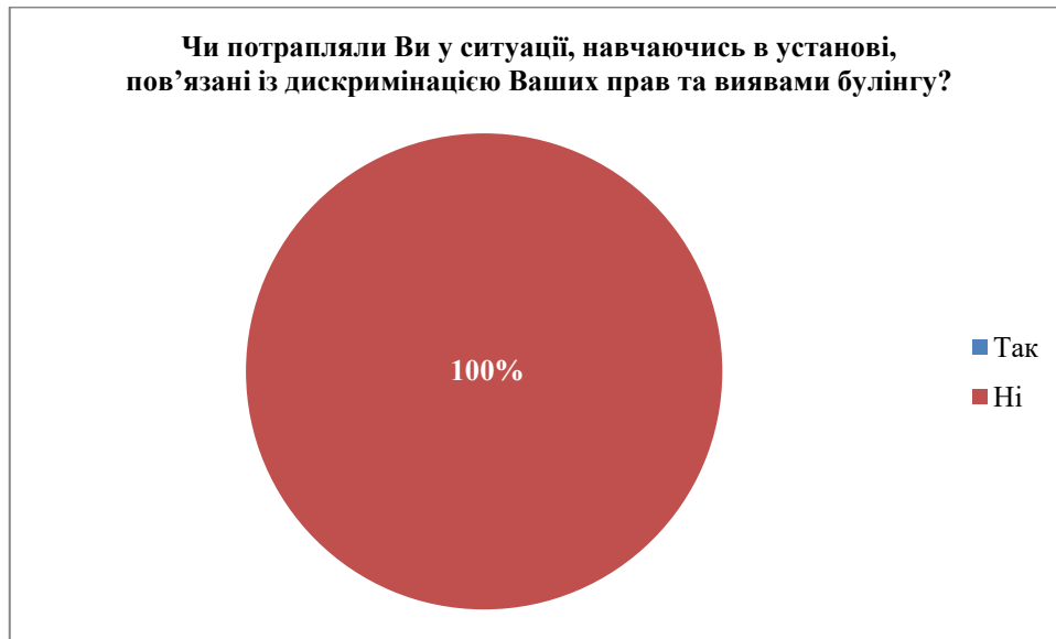
Рис. 2. Дискримінація прав та вияви булінгу, під час навчання в установі, щодо здобувачів

Згідно з цим опитуванням, здобувачам не відомо про випадки сексуальних домагань в установі.