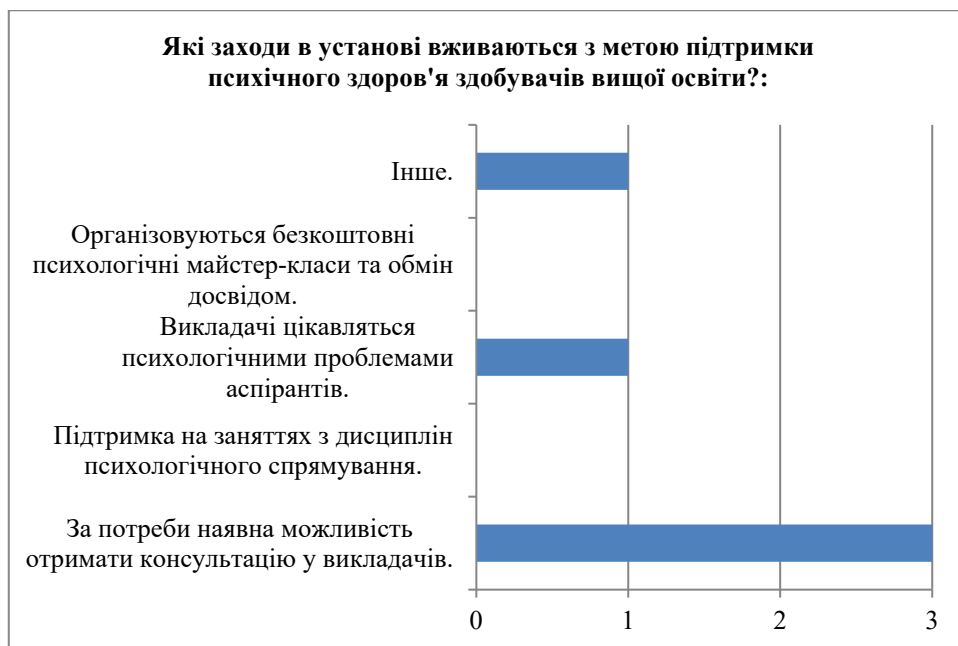
Рис. 5. Заходи в установі щодо підтримки психічного здоров'я здобувачів вищої освіти

На рис. 5 відображено відповіді на питання: Які заходи в установі вживаються з метою підтримки психічного здоров'я здобувачів вищої освіти?