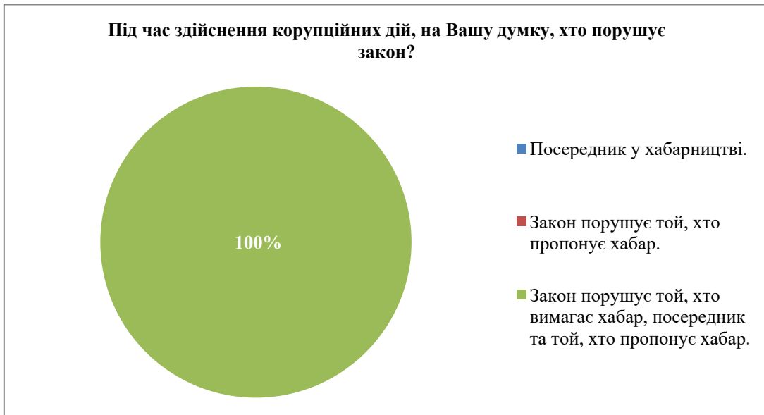
Рис. 2. Порушники закону під час здійснення корупційних дій, на думку здобувачів

Всі здобувачі вважали, що корупція не може бути виправданою, як показано на рис. 3.