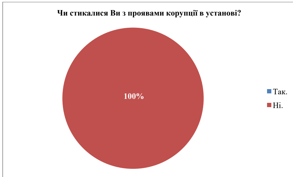
Рис. 6. Корупція в установі

Всі здобувачі готові особисто протидіяти корупції, що показано на рис. 7.