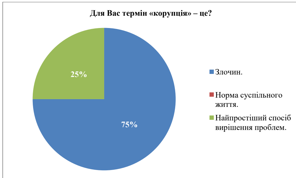
Рис. 4. Тлумачення терміну «корупція» здобувачами

У всіх аспірантів корупція у навчальному процесі асоціювалася з випуском некваліфікованих фахівців, як показано на рис. 5.