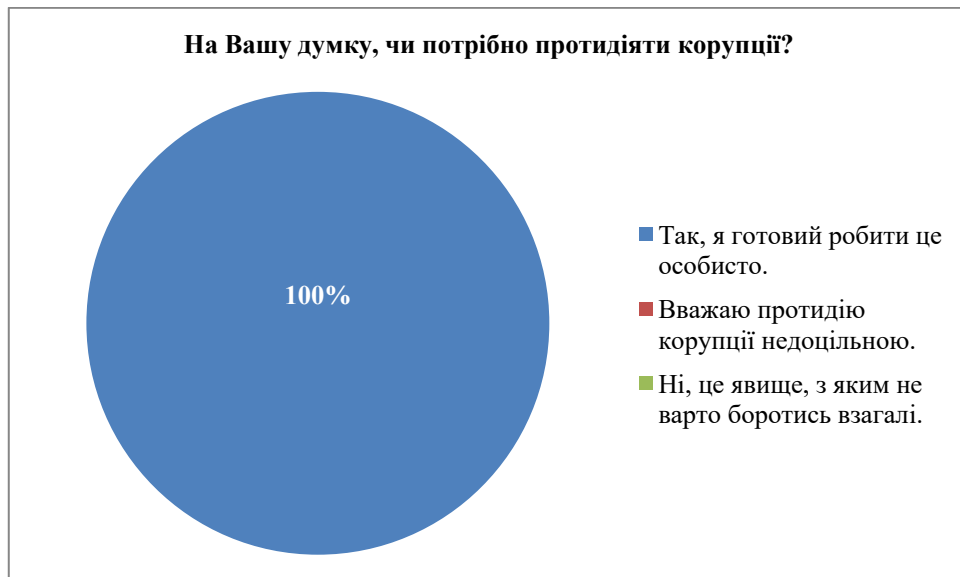
Рис. 7. Готовність здобувачів протидіяти корупції

Всі здобувачі готові особисто протидіяти корупції, що показано на рис. 7.