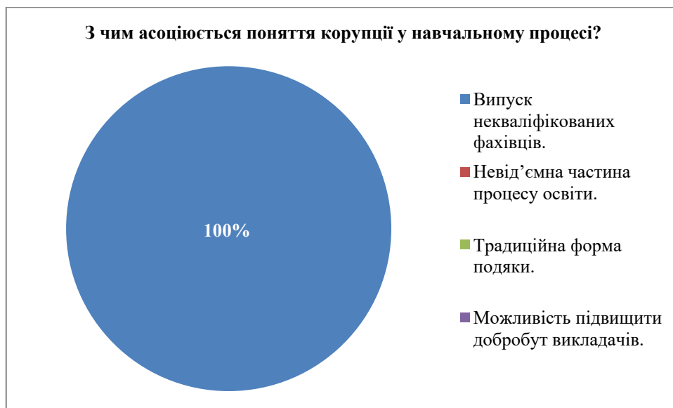
Рис. 5. Асоціації з поняттям «корупція у навчальному процесі» у здобувачів

У всіх аспірантів корупція у навчальному процесі асоціювалася з випуском некваліфікованих фахівців, як показано на рис. 5.