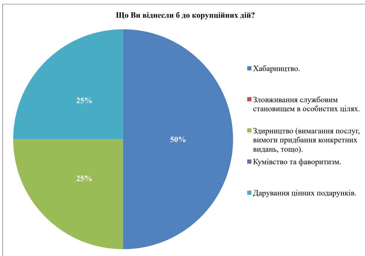
Рис. 1. Тлумачення поняття корупційні дії здобувачами

Анонімне анкетування «Молодь проти корупції» містило 7 запитань, з яких перше питання визначало персональне тлумачення поняття «корупційні дії» здобувачами. З 4 анонімно опитаних респондентів – 2 вважали корупційні дії хабарництвом, 1 – здирництвом (вимаганням послуг чи придбання конкретних видань, тощо) та ще 1 респондент вважав корупційними діями дарування цінних подарунків.